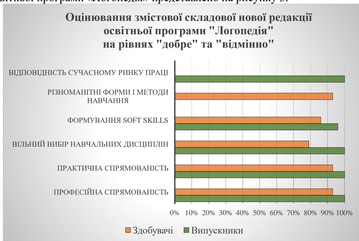
Рисунок 3. Оцінювання змістової складової нової редакції освітньої програми «Логопедія» випускниками та здобувачами

Узагальнено результати оцінювання змістової складової нової редакції освітньої програми «Логопедія» представлено на рисунку 3.