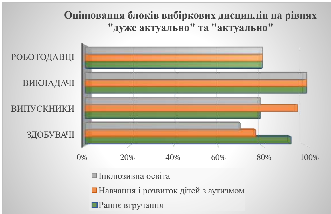
Рис.4. Актуальність блоків вибірових дисциплін

Результати опитування дають змогу узагальнити, що на високому рівні актуальність блоків вибірових дисциплін оцінили представники академічної спільноти (викладачі) по 100%.