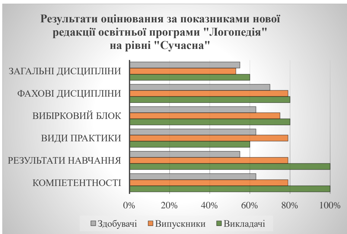
Рис. 2. Результати оцінювання за показниками осучаснення нової редакції освітньої програми «Логопедія» на рівні «Сучасна»

Узагальнені результати оцінювання за показниками рівня осучаснення нової редакції освітньої програми «Логопедія» представниками академічної спільноти (викладачами), випускниками та здобувачами на якісному рівні оцінки «Сучасна» представлено на рисунку 2.