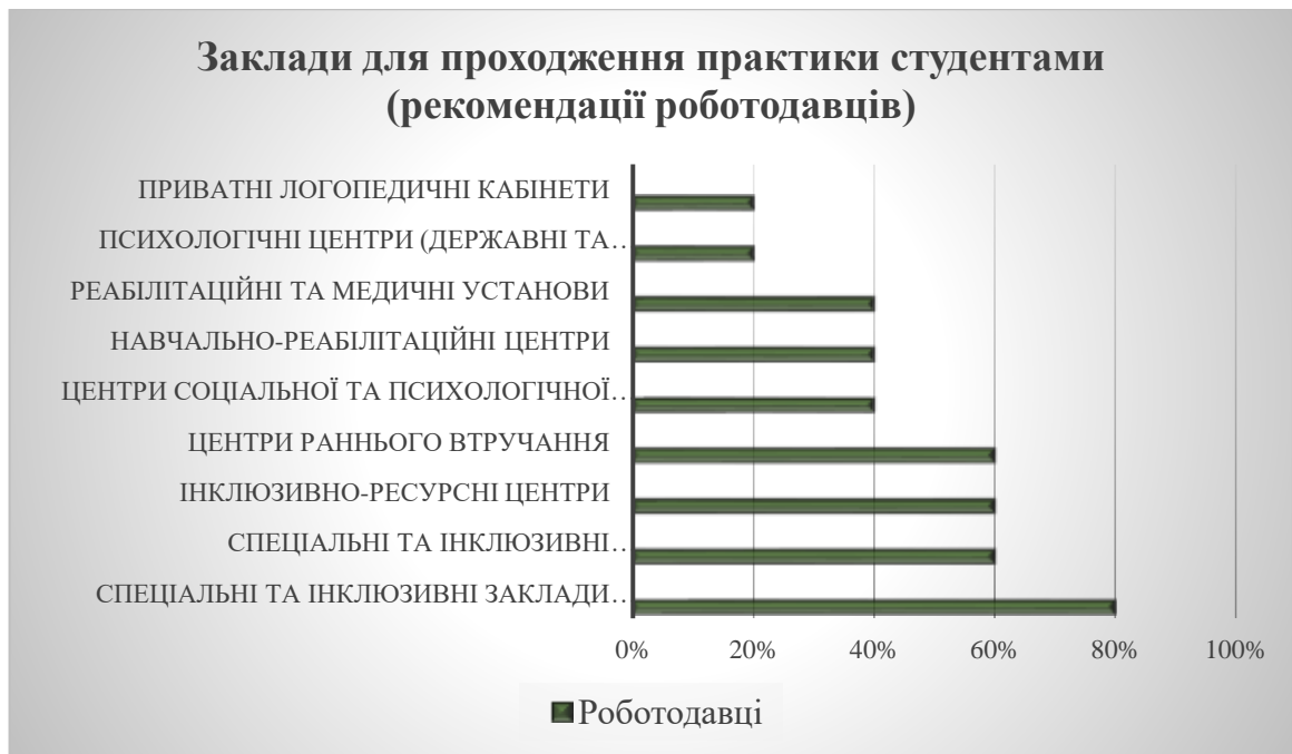
Рис.4. Рекомендовані роботодавцями заклади для проходження практики студентами

Серед рекомендованих закладів для проходження практики роботодавцям було запропоновано обрати такі: приватні логопедичні кабінети; психологічні центри (державні та приватні); реабілітаційні та медичні установи; навчально-реабілітаційні центри; центри соціальної та психологічної реабілітації дітей та молоді; центри раннього втручання; інклюзивно-ресурсні центри; спеціальні та інклюзивні загальноосвітні заклади; спеціальні та інклюзивні заклади дошкільної освіти.