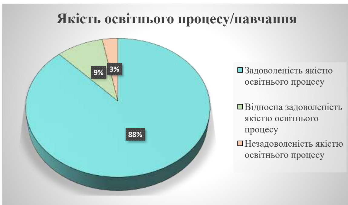
Рис. 3. Міра задоволеності здобувачів якістю освітнього процесу / якістю навчання (моніторинг кафедри 2021)

оцінювання якості освітнього процесу здобувачами представлено у вигляді діаграми (Рис 3.).