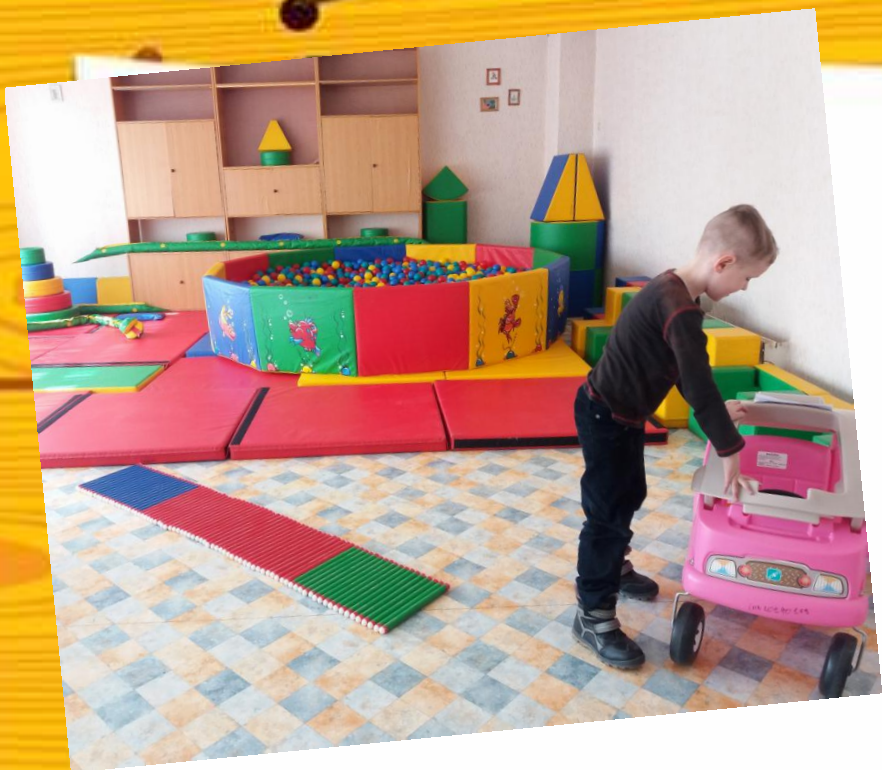
Корекційно-розвивальне заняття у сенсорній кімнаті