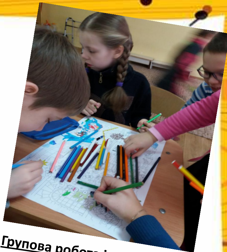
Групова робота із 3-В класом